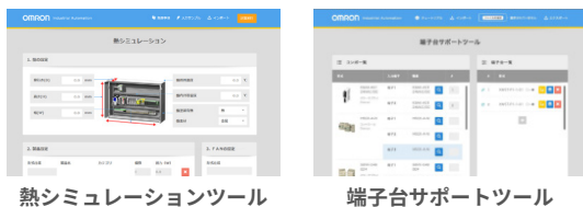
熱シミュレーションツール

部品リストに登録した商品の仕様情報を活用し、設計支援ツールが使用できます。商品ごとにカタログ等で確認・入力する手間がなく簡単に使用できます。